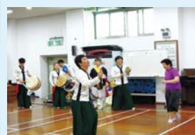
6.19 한삼자락 따라 우리음악여행