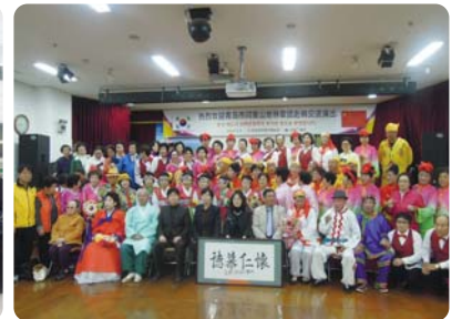
중국 청도시 염가산지앙가예술단