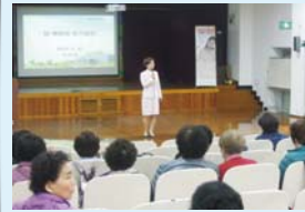
3.27 암예방과 국가건강검진 특강