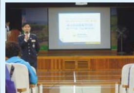
5.1 밝은세상만들기 특강