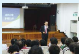
7.10 기초연금 및 노후설계