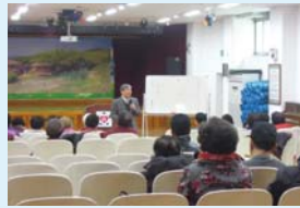
3.13 달라지는 노인정책 특강