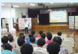
5.8 치질, 대장질환예방강연