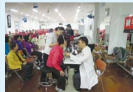
4.24 안질환 특강 및 안과검진