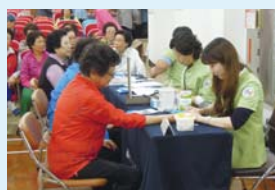
5.15 당뇨,혈압 특강 및 건강검진