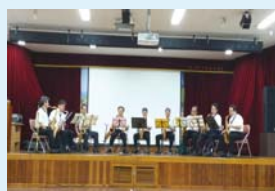
6.12 색소폰양상블 공연